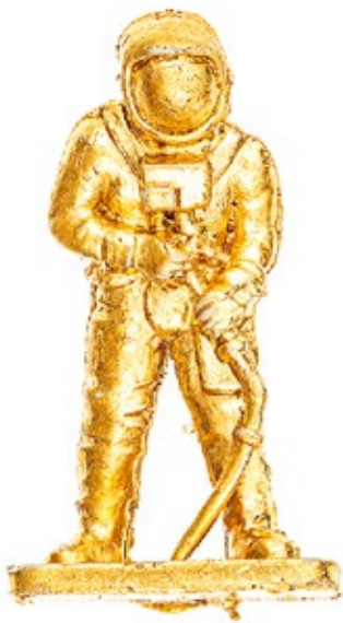
AUS KLEIN WIRD GROSS: Der goldene Astronaut ist im Original nur wenige Zentimeter groß. In der Fotoausstellung entfaltet er im übergroßen Maßstab allerdings erst seine volle Wirkung.

→ zusammenkommen, um aufzuräumen, werden wieder zahlreich angeboten. Denn Müll findet sich leider immer und überall und tatsächlich auch aus allen Bereichen: Da gibt es die Silofolie vom Landwirt genauso wie das Einweg-Sektglas vom Hochzeitsumtrunk oder die Radkappe, die dem Verschleiß zum Opfer fiel. Dementsprechend schwer ist es natürlich auch eine Zielgruppe für die Aufklärung zu definieren und mit jedem neuen Fund stellt sich heraus: Die Zielgruppe sind wir alle. Und hin und wieder gibt es auch gar keine echten Schuldigen : „Gelbe Säcke fliegen bei Wind gerne mal durch die Gegend und landen auch schon mal in Flüssen“, erzählt Horch.