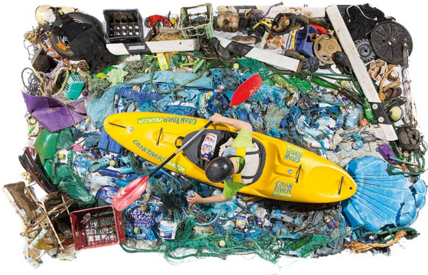
DAS IST BEÄNGSTIGEND: So viel Müll findet sich durchschnittlich in einem Kilometer Fluss in Deutschland.