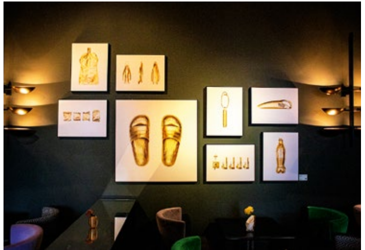
MÜLL BEGREIFEN: Bei den Kunsttagen Winnigen stellt das Clean River Project im Mai 2022 die Serie PURES GOLD aus. Um das Erlebnis greifbarer zu machen, wird Müll drapiert, der von Freiwilligen auf einer Strecke von sechs Kilometern aus der Mosel gefischt wurde (unten).