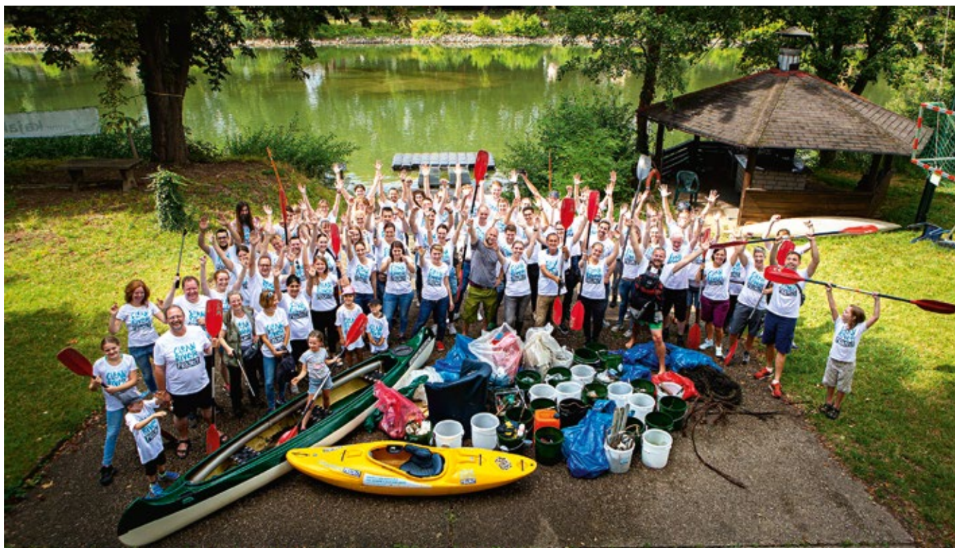
EINE STARKE TRUPPE: Gruppenbild nach einem Clean-up-Event vom Clean River Project. Ohne Freiwillige und Menschen, die Spaß daran haben, etwas für die Umwelt zu tun, geht es nicht.

Mit der Fotografie Umweltbewusstsein schaffen