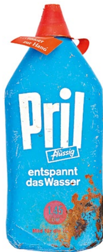
HÄLT EWIG: Der D-Mark-Preis gibt erste Hinweise auf das Alter der blauen Pril-Flasche.